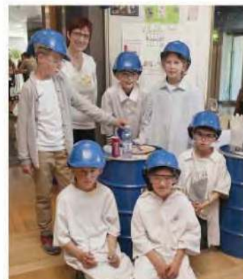
Die Schüler der Volksschule Stanz präsentierten ihr Projekt der Jury.