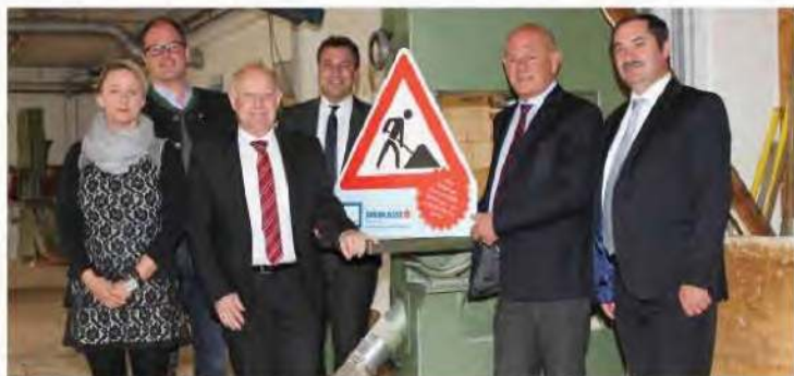
Die Sparkasse Imst AG und Bauunternehmer waren sich einig: Die regionale Wirtschaft profitiert vom Anstieg der Singlehaushalte.

Hinzu kommt, dass kaum noch Zeit bleibe, größere Projekte zu realisieren, weil die Arbeiten im Tourismus sich auf die Zwischensaison von Mai bis August verlagern. „Daher ist auch der Wohnbau